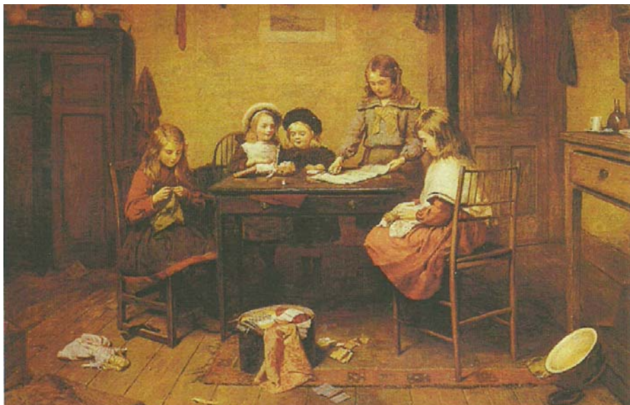
11. kép Az ifjú varrónők (1893). Olaj, vászon, 72×92 cm. Sotheby's, London