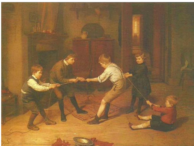
1. kép Kötélhúzás (1890). Olaj, vászon, 68×89 cm. Geffrye Museum, London

A fiúk és a lányok nevelése, a velük szemben megfogalmazott, vagy csak hallgatólagos, de tradicionális elvárások mindig is mások voltak. Ez az ál-