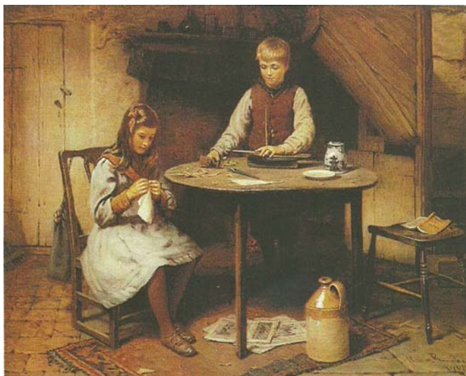
4. kép Hajóépítő (1908). Olaj, vászon, 40×50 cm. Christie's, New York