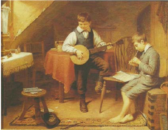
15. kép Egy duett (1898). Olaj, vászon, 34×44 cm. Dallas Auction Gallery