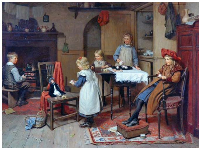
10. kép Délutáni tea (1895). Olaj, vászon, 72×86 cm. Smith Art Gallery, Stirling

A játék természetesen a lányok számára is rendkívüli szocializációs tanulási terep. A babázás nemcsak felkészülés a majdani anyaszerepre, de sajátos keretet teremt a társasági élettel való ismerkedésre is. Szépen példázza mindezt a Délutáni tea c. kép (10. kép), amelyről az is leolvasható, hogy itt változnak a szerepek, itt a fiúk válnak érdeklődő külső megfigyelőkké. Talán ők nem olyan erősen vágnak a lányok játékába való bekapcsolódásra, de érezhetően őket sem hagyja az hidegen.