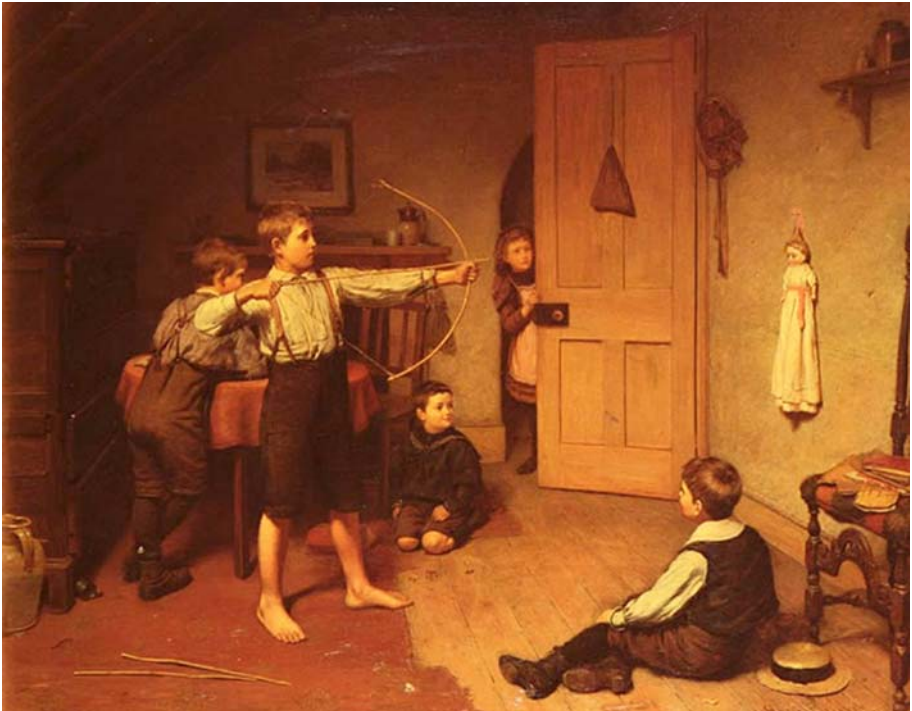
8. kép Az íjász (1894). Olaj, vászon, 71×92 cm. Art Resource Centre, New York

val. A játék és a vetélkedés iránti természetes késztetés útjából tehát éppen a modernitás emberközpontú szemlélete hártotta el az ideológiai akadályokat.” 7