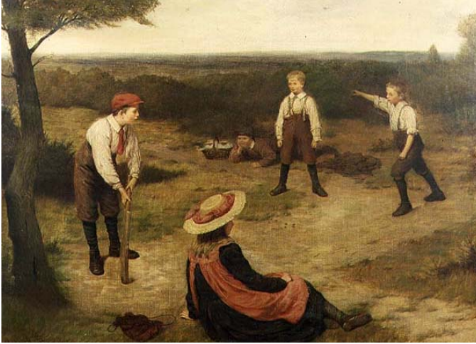
7. kép Krikettjáték (1904). Olaj, vászon, 70×90 cm. Christie's, London