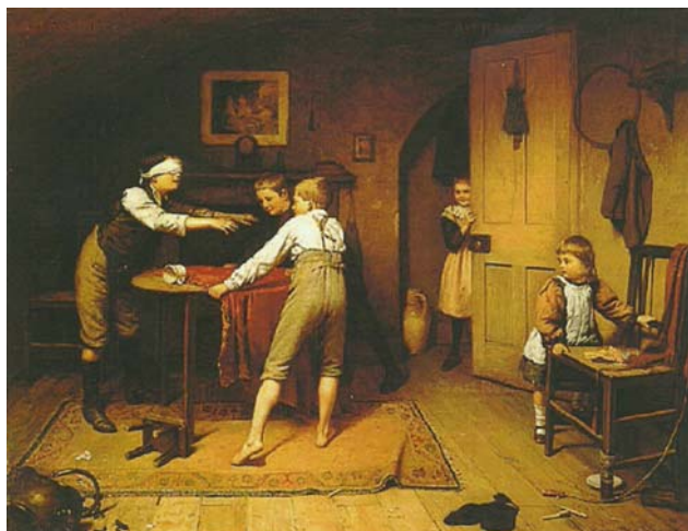
2. kép Szembekötődsi (1898). Olaj, vászon, 72×92 cm. SPB Gems, New York

fiú verseng egymással, tekintetük, testtartásuk egyaránt arról árulkodik, milyen nagy jelentőségű aktus ez gyermeki életükben, a családon belüli gyermeki hierarchia kialakításában. A két kisebb – húguk és kisöccsük – periférikus résztvevői az eseménynek, de részt kapnak benne, kifejezve ezzel a családi gyermektársadalom együvé tartozását. A szembekötődsi (2. kép) tulajdonképpen nem csak a fiúk játéka, de Brooker képe jól példázza, mit szimbolizálhat, ha a csa-