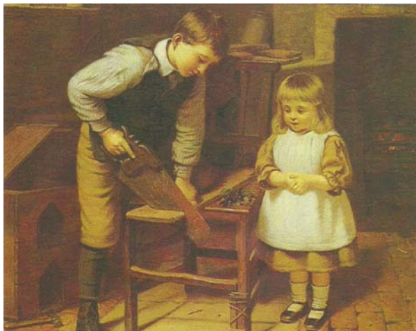
3. kép Mesterkedés a gyerekszobában (1897). Olaj, vászon, 34×44 cm. Sotheby's, London

A barkácsoló fiúk mellett a lányok varrnak, kötnek, horgolnak, vagy nagyra nyílt szemmel csodálják fivéreik ügyeskedését.