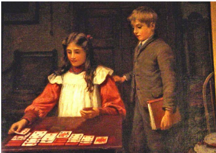
19. kép Pasziánsz . Olaj, vászon