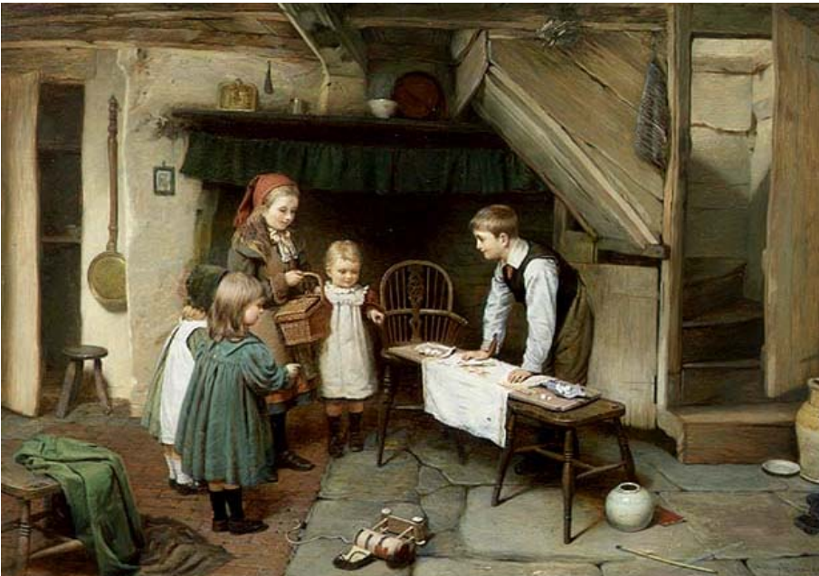
14. kép Látogatás az édességboltban (1897). Olaj, vászon, 72×92 cm. Haynes Fine Art, Worcestershire

hosszú évszázadokon keresztül szerepjátékon mást értettek a gyermekek és a pedagógia művelői egyaránt. „A kicsiknél a cselekvés, a nagyobbaknál a tárgy, a legnagyobbaknál a szerep hordozza a témát ” – állapítja meg a szerepjátékról Mérei Ferenc, kiegészítve azzal, hogy: „...a tematikus játékok egyik fejlettebb változatában a szerep válik a játék anyagává.” 8 A szerepjáték tradicionálisan, és így Brooker képein is a