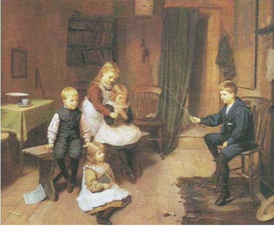
13. kép Iskolásosdi (1900). Olaj, vászon, 72×92 cm. Sotheby's, New York

felnőtt világ megismerésének, a felnött szerepek elsajátításának egyik kiváló, szórakoztató eszköze volt, amit a gyermekek mindig is imádtak. A szerepjátékok során fiúk és lányok együtt játszhattak. Ilyen a legkisebbek köcsikázós játéka (12. kép), aztán a már nagyobbak iskolás és boltos játéka (13-14. kép).