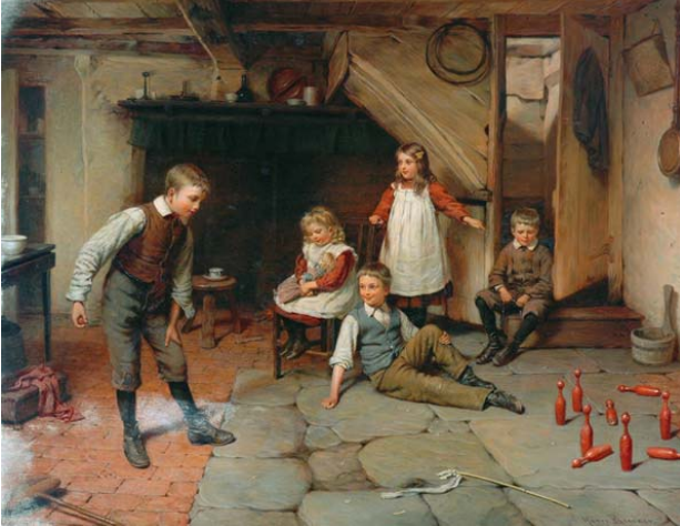
9. kép Tekézés (1905). Olaj, vászon, 71×86 cm. Smith Art Gallery, Stirling

szetesen mindezek a férfiak kiváltságai, tehát a fiúgyermek játékei közé tartozik az ismerkedés velük. A lányok ismét csak passzív csodálói a fiúk játéknak. Különösen érdekes Az újász c. kép (8. kép), amelyen a fiúk céltáblának hűguk egyik babáját szemelték ki. A kislány ijedten figyeli a fejleményeket.