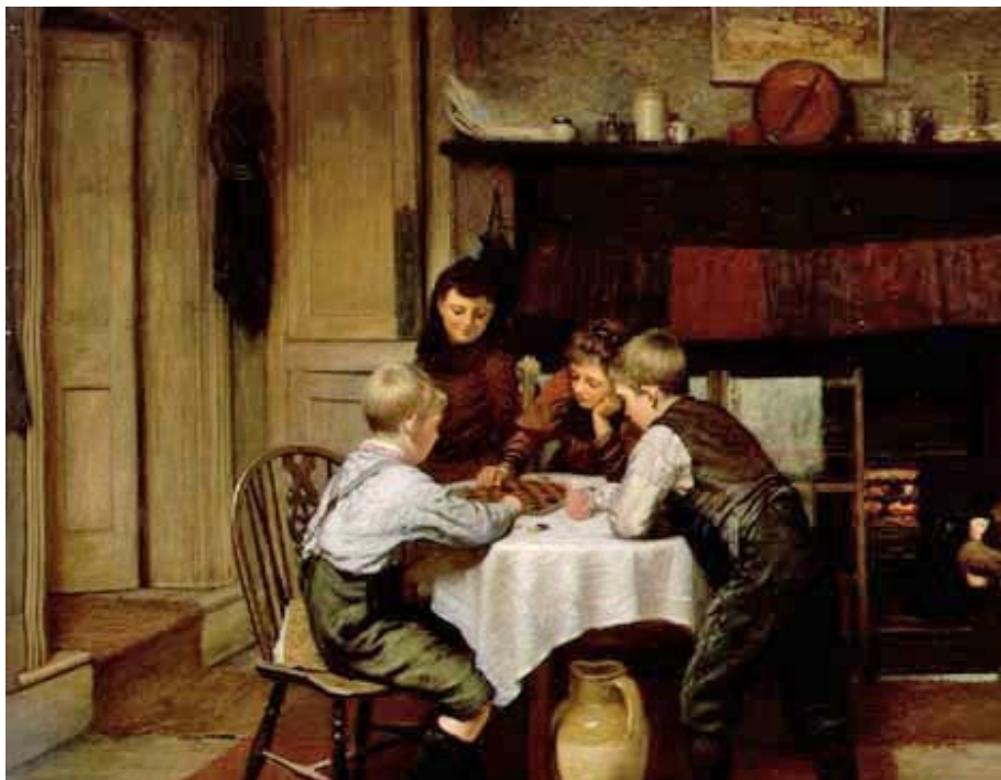
20. kép Egy szoros játszma (1894). Olaj, vászon, 72×92 cm. Haynes Fine Art, Worcestershire