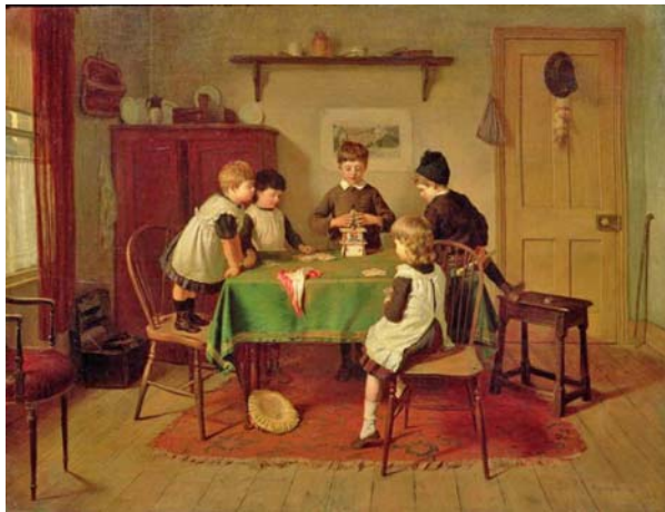
18. kép A kritikus pillanat (1889). Olaj, vászon, 72×80 cm. Forbes Collection, New York

hosszú idő óta a gyermekek egyik legkedveltebb kártyajátéka (18. kép), de festett képet pasziánszozó kislányról (19. kép), dámázó gyermekekről is (20. kép).