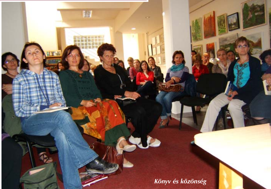
Könyv és közönség