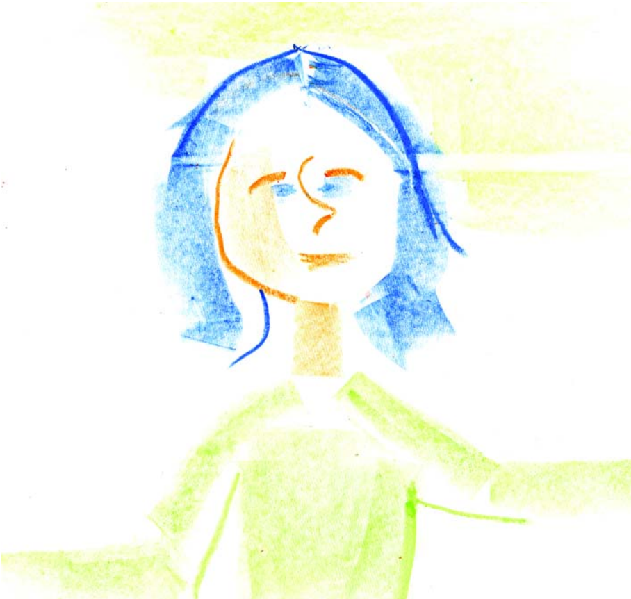
Az eszes nagymama