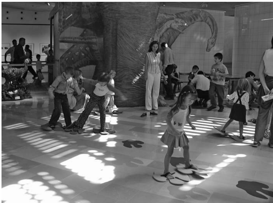
Járj úgy, mint egy Iguanodon!

A ma élő madarak ősi rokonságát, a tollas dinókat bemutató tárlat felbecsülhetetlen értékű tárgyi anyagával, elegáns installációjával és képi világával, felnőtteknek szóló szövegeivel és lenyűgöző interaktív berendezéseivel a 12 év feletti korosztály számára volt teljes egészében befogadható. A kiállítás ezen adottságaival szerencsére már idejekorán szembesültünk, így volt lehetőségünk a megoldáson gondolkodni. A problémát az jelentette, hogy mivel minden kiállítás, amely bármilyen módon dinókról szól, kisgyermekes családok és csoportok ezreit mozgatja meg. Így a szülőknek, nagyobb testvéreknek valódi intellektuális csemegét jelentő tárlatot nem hagyhattuk önmagában állni, ki kellett egészítenünk kisebbeknek szóló elemekkel.